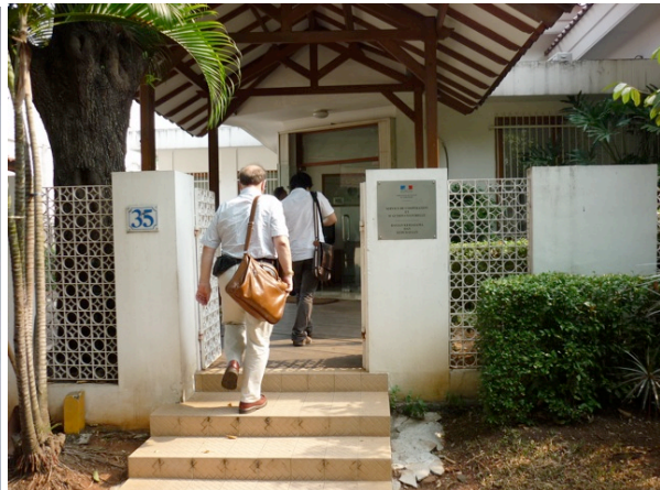
Service de coopération et d'action culturelle