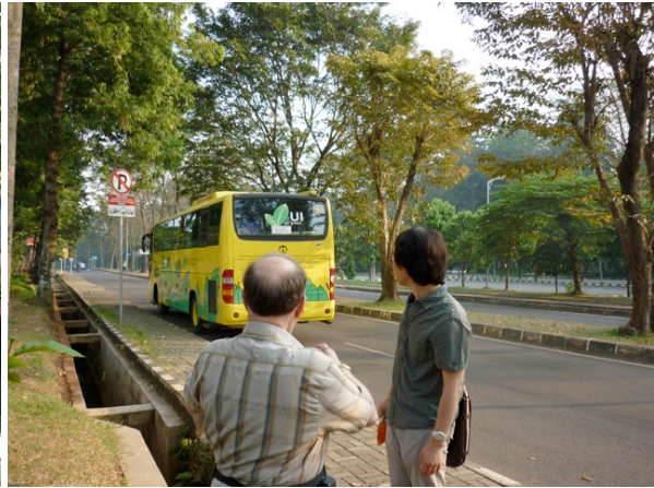
Service de bus actuel