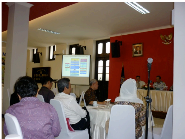
Ministère des transports