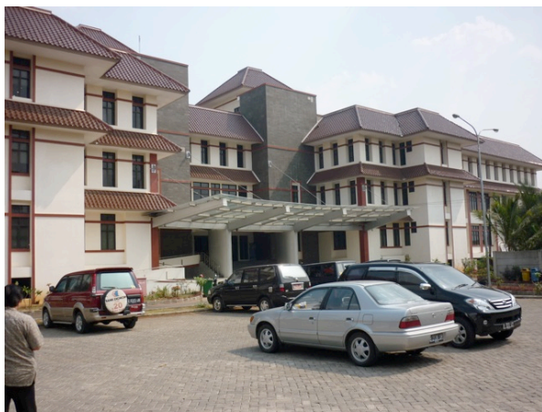
Mairie de Depok