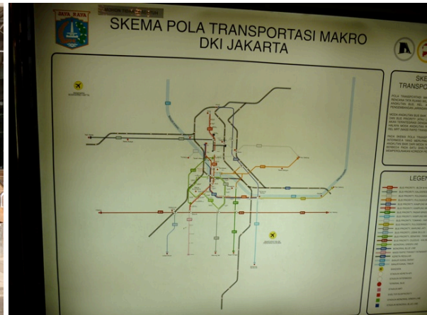
Schéma directeur des transports de Jakarta