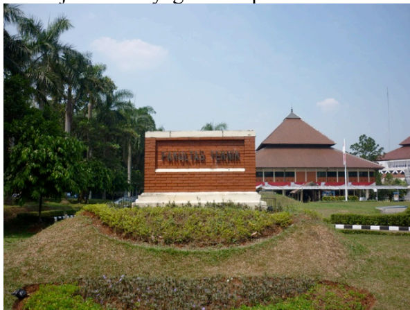
Faculté d'ingénierie à l'UI