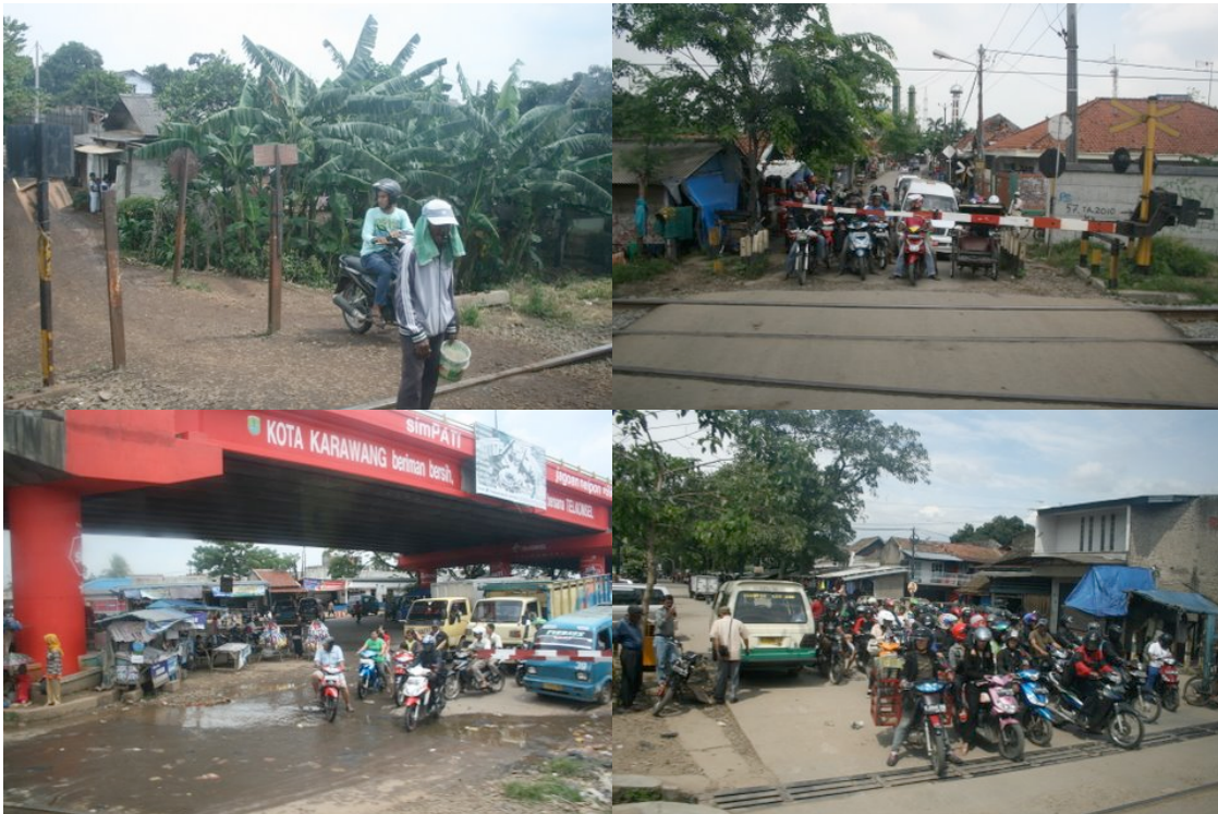
Différents types de passage à niveau sur la voie de Jakarta à Bandung