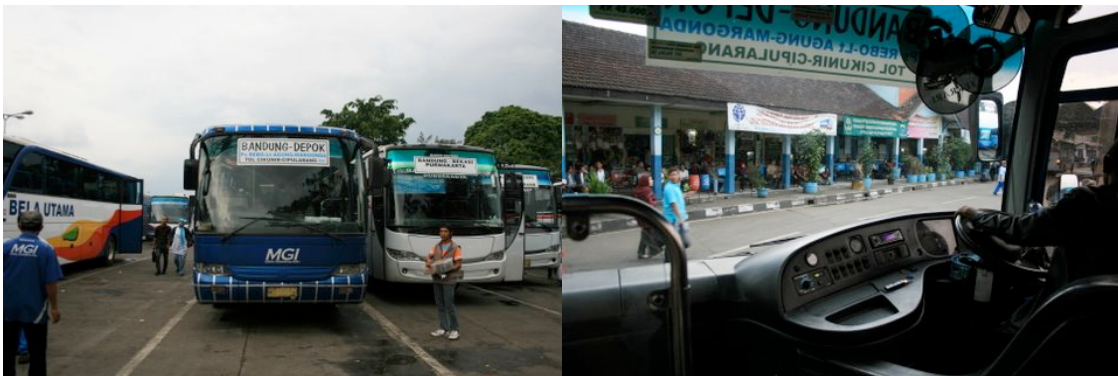
Autobus qui dessert de Bandung à Depok