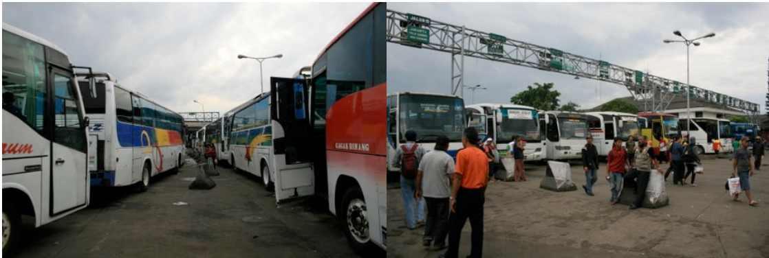
Autobus au Terminal Leuwipanjang à Bandung

L'autobus est suffisamment confortable et moins cher (60 000 rupiahs p/r 70 000 de Bandung à Depok) par rapport au service de train, et surtout offre des services directs entre deux villes permettant aux usagers d'éviter de passer par Jakarta pour aller à leur destination autour de Jakarta.