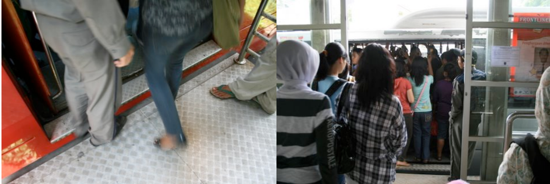
Au niveau du quai ( TransJakarta )

TransJakarta est l'un des modes de transport les plus performants à Jakarta même s'il est saturé et embouteillé notamment à Harmonie . De plus, il n'existe aucune priorité aux feux au niveau des carrefours pour le service de TransJakarta , ce qui pose pas mal de problèmes de régulation du service et de sécurité aux personnes.