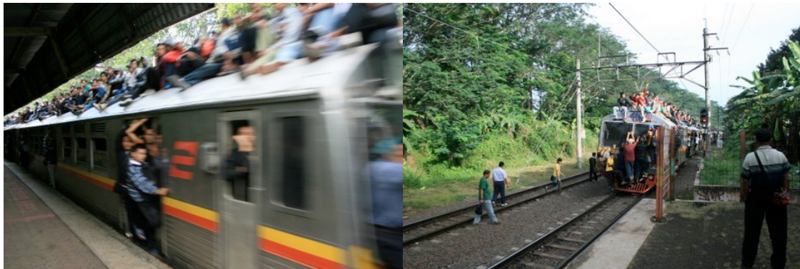
Utilisation « type » du RER classe économique à l'heure de pointe