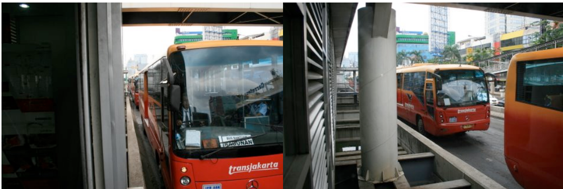
Queue d'autobus du TransJakarta à Harmonie