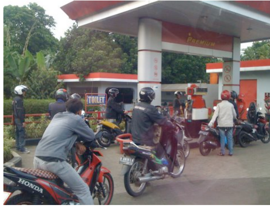
Les motos font la queue à la station de service à Depok (plus que les automobiles)

Cette subvention devrait finir au début de 2011.