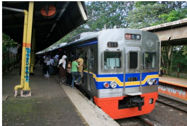
Train de classe économique A/C (avec climatisation), pas de passager en toiture