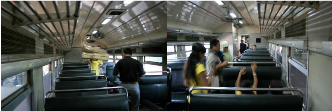
Intérieur de la classe Bisnis

Cirebon est une ville située de l'est de Jakarta (297 km) sur le principal axe ferroviaire entre Jakarta et Surabaya qui a relativement un bon état de la voie permettant d'offrir un bon service tout au long du trajet jusqu'à Cirebon dit «CirebonEkspres».