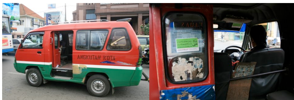
Angkot à Bandung