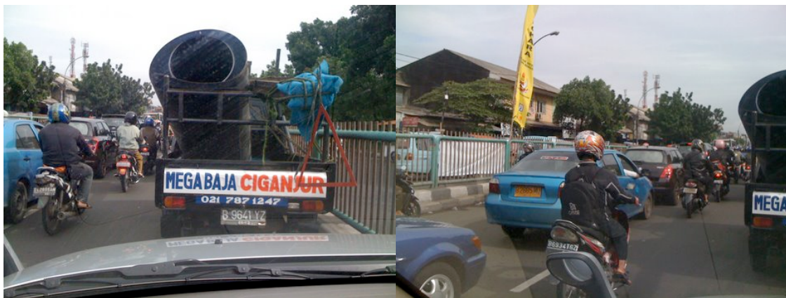
Différents types de plaque d'immatriculation selon le type de subvention (noir et jaune)