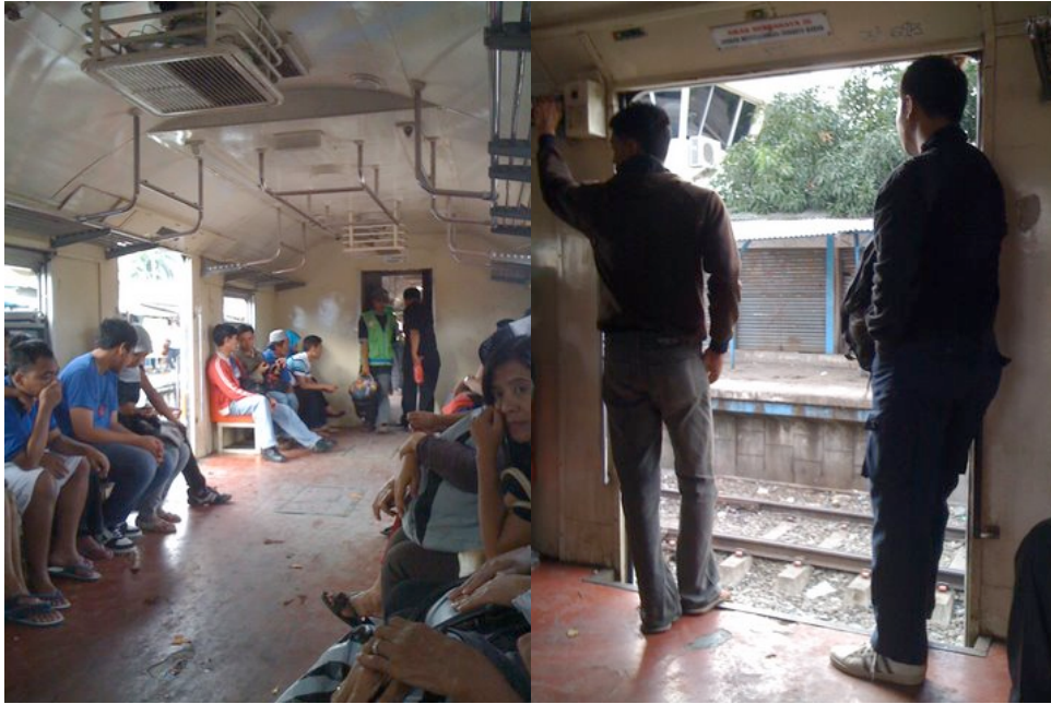
Intérieur d'un train économique sans climatisation