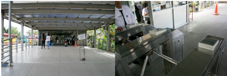
Terminus Kalideres ( TransJakarta ) équipé d'un système de contrôle avec carte