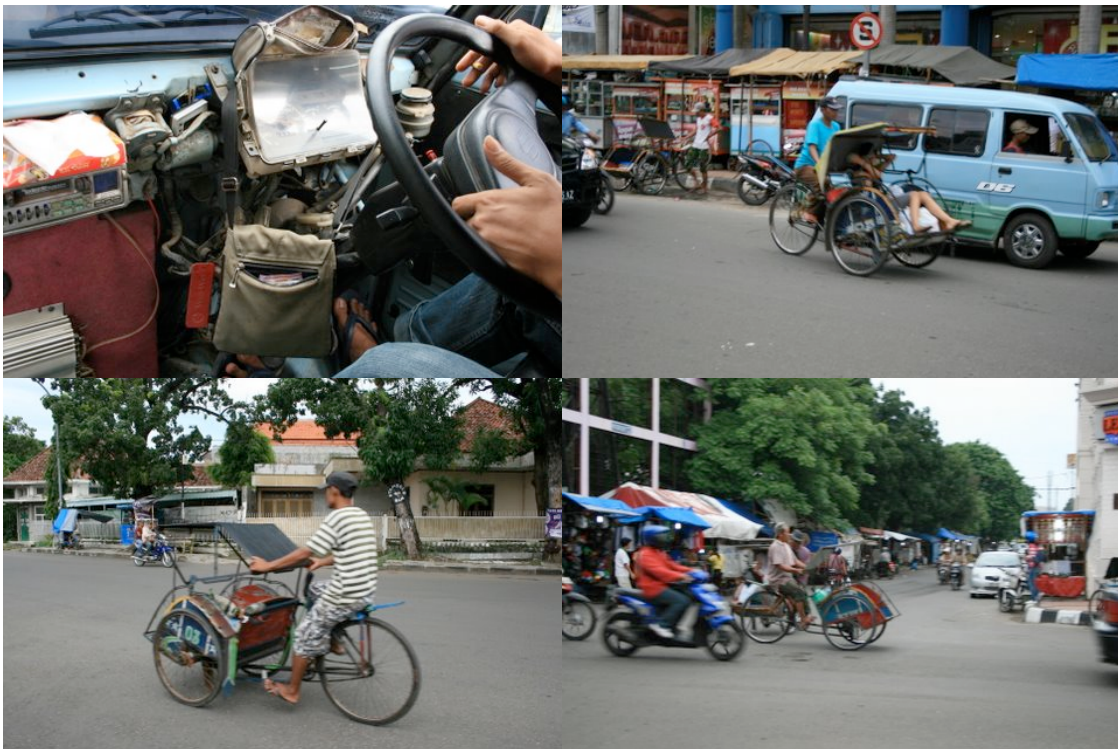
Angkot et Becak à Cirebon