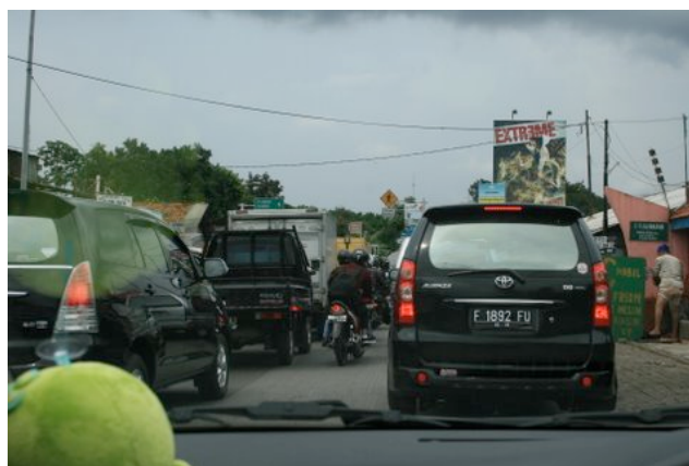
Embouteillage permanent entre Depok et Jakarta