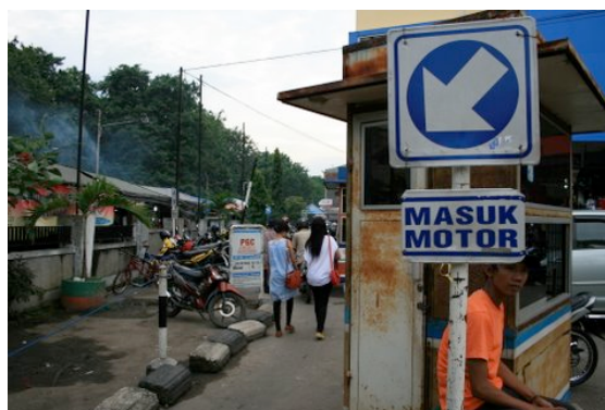
Entrée du parking réservé aux motos à Cirebon