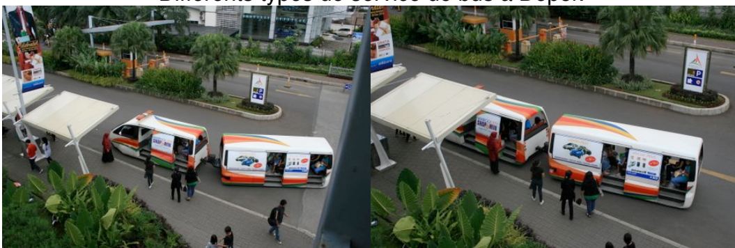
Service de navette aux clients d'une grande surface « Margo City » récemment ouverte