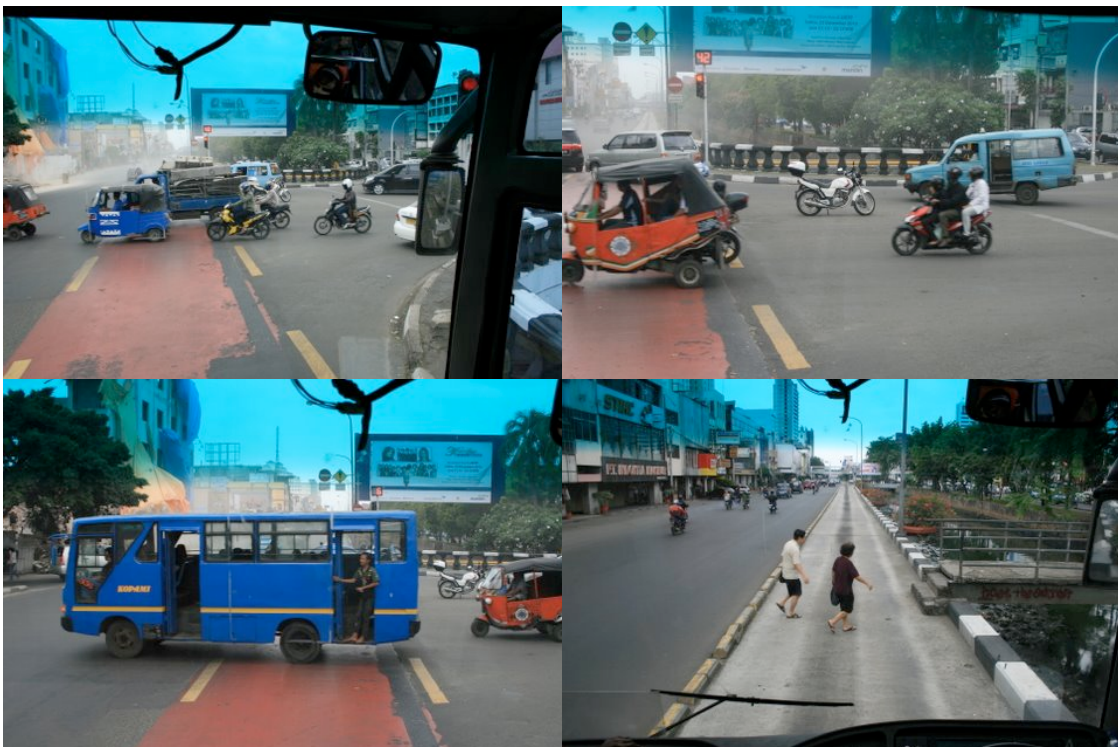
Aucune priorité pour l'autobus du TransJakarta