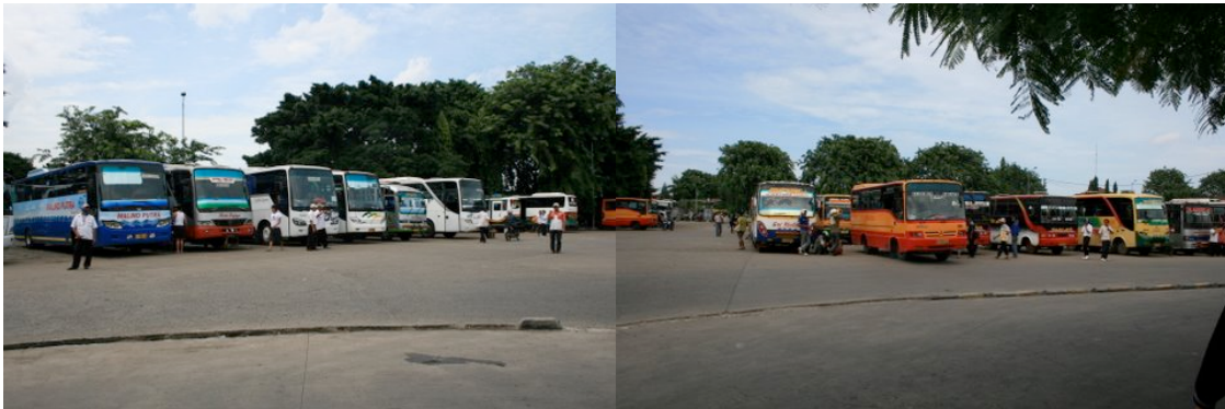
Des autobus au terminal Kalideres

Kalideres Bus Terminal assurant principalement des services d'autobus vers l'ouest de l'île de Java, se situe à 15 km au nord-ouest du centre de Jakarta ce qui oblige les passagers à perdre plus de 30 minutes pour s'y rendre même en utilisant le TransJakarta .