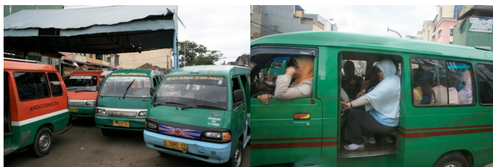
Terminal de l'Angkot à Bandung et un Angkot bien rempli