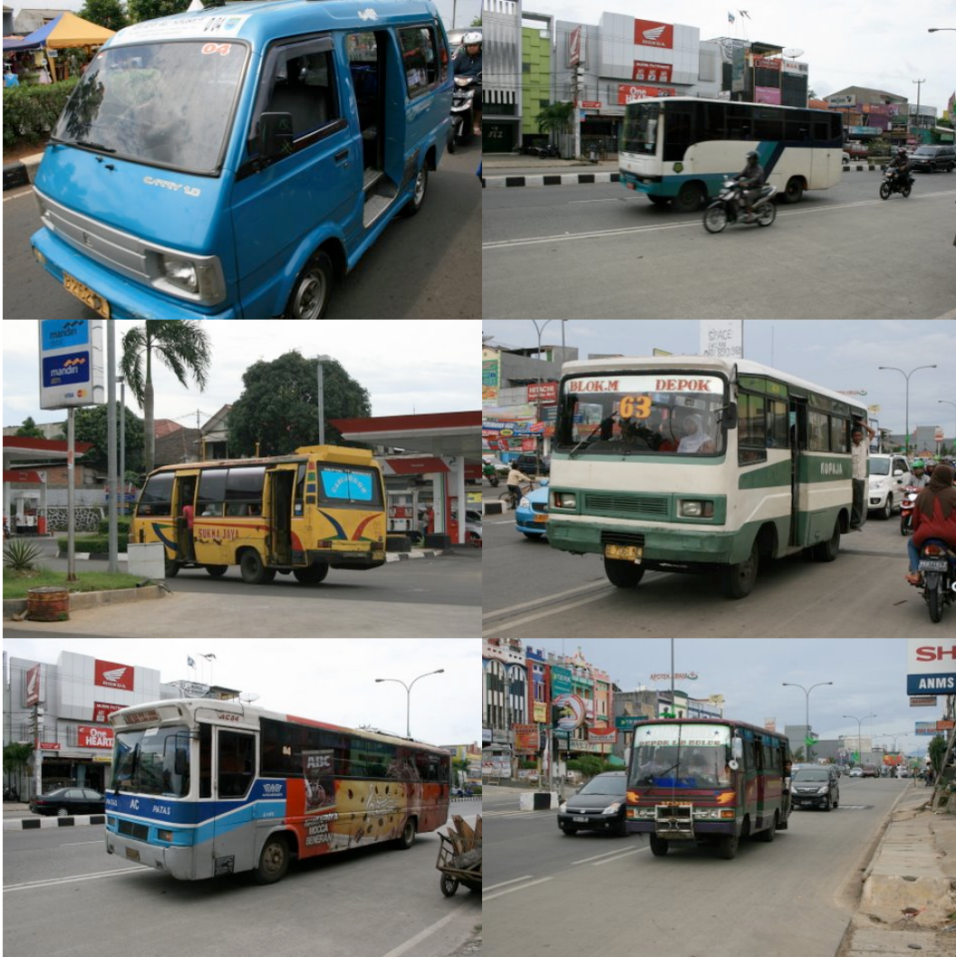
Différents types de service de bus à Depok

Différents types de service de bus existent à Depok. En ce qui concerne le service RER, comme il n'y a pas d'information affichée en temps réel, les trains n'arrivent pas à l'heure exacte et le service est assez compliqué pour les non connaisseurs, on doit en permanence demander soit aux agents de contrôle ou de sécurité soit aux « gentils » indonésiens.