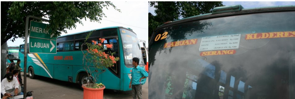
Autobus pour Merak, Labuan et Serang