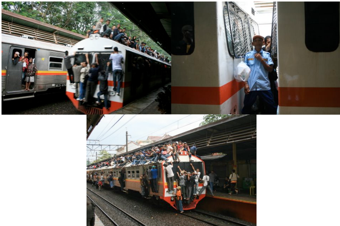
Utilisation maximum d'un train économique « avec beaucoup plus de capacité théorique »