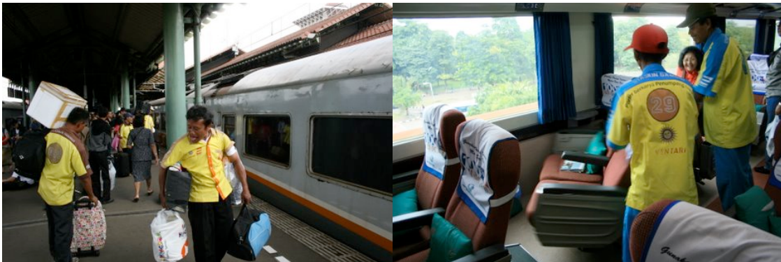
Porteur de valises à la Stasiun Gambir (Jakarta) et intérieur de la classe Eksekutiv