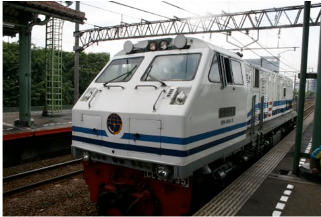
Locomotive Diesel à la Stasiun Gambir (Jakarta)

La ligne n'est pas électrifiée et est exploitée avec des locomotives Diesel.