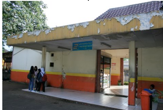
Entrée de la station UI

La desserte par le RER est relativement bonne mais la sécurité des passagers n'est pas toujours garantie. On privilégie la capacité « poussée ou renforcée ». à la sécurité. Les réseaux routiers reliant Jakarta à l'UI (autoroute Jakarta-Bogor et route régionale) sont toujours embouteillés notamment à l'heure de pointe.