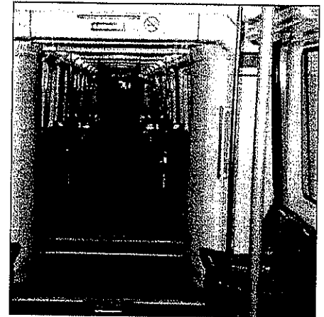
Dos vistas del interior de las unidades.

Los dos coches extremos cuentan con un pupitre de conducción, que se encuentra tapado por una protección. En caso de necesidad el tren puede ser operado manualmente, por ello basta con descubrir el pupitre, en el que se encuentran todos los mandos necesarios para la conducción, con una sencilla maniobra sobre la protección.